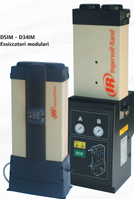
D411M - D2991M Essiccatori modulari